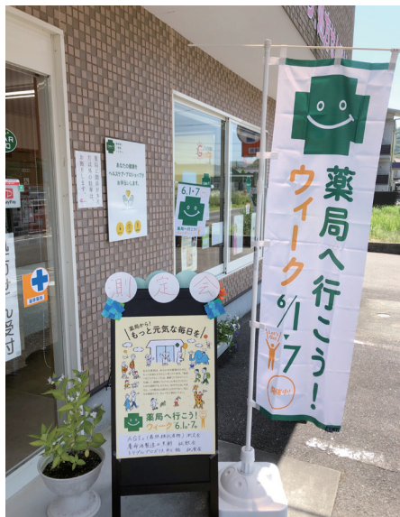
のぼりやフラッグ、ポスターを活用して健康イベントがある1週間をアピール

試飲会ひとつとっても、「薬局へ行こう！ウィーク」の機会に、AGEs（糖化）測定で自分の体を数値で知り、患者さん一人ひとりの健康を考えて試飲を提案することで、普段商品棚に陳列されている商品が自分の体に良いと知って納得して購入していくきっかけを作っている。