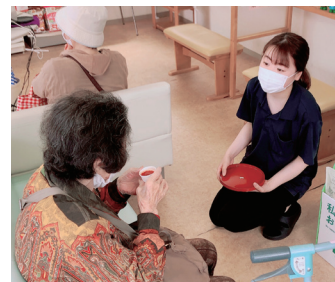
養命酒製造の黒酢試飲はトマトジュース割りが大人気